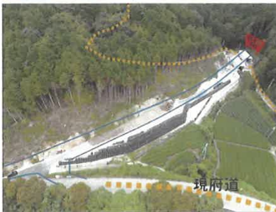
現道との接続部 (事業区間終点側)