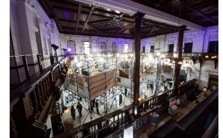
A F K 2022