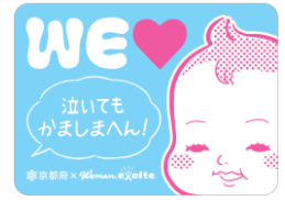
「泣いてもかましまへん！」 ステッカー