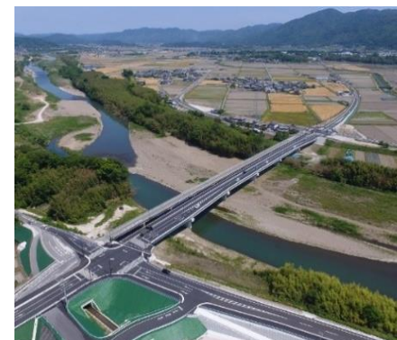
一般府道郷ノ口余部線（宇津根橋） （亀岡市）