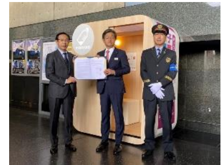
京都駅のベビーケアルーム