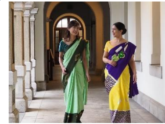
西陣織・京友禅・丹後織物の3産地が連携し、京都を世界的なシルクテキスタイルの産地に