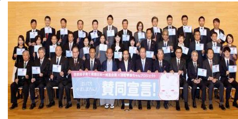
きょうと子育て環境日本一サミット (R3.11.3)