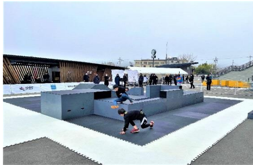
キッズチェイスタグ大会