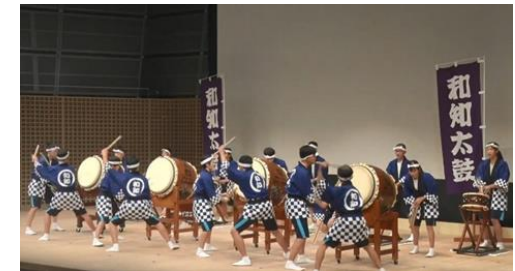
全国高校生伝統文化フェスティバル

＜全国高校生伝統文化フェスティバル参加者 868人＞ ＜児童生徒等が学校等で体験する文化活動事業数 63件＞