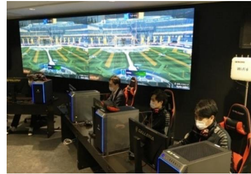
eスポーツの大規模大会