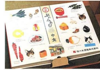
京都プレミアム中食の開発を支援