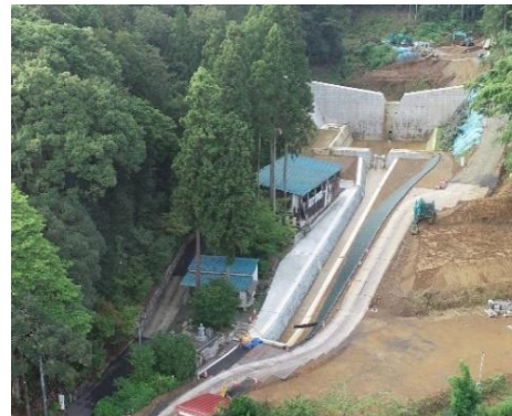
大島川砂防堰堤（舞鶴市）