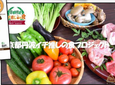
昨年度事例発表より