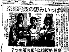
7つの道の駅「七彩駅弁」開発