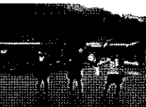
美山・茅葺きの里