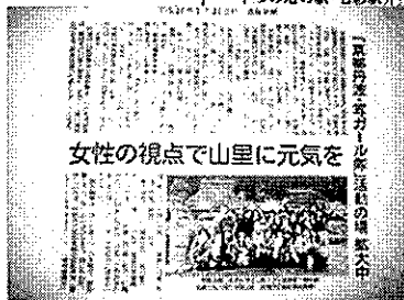
女性の視点で山里に元気を