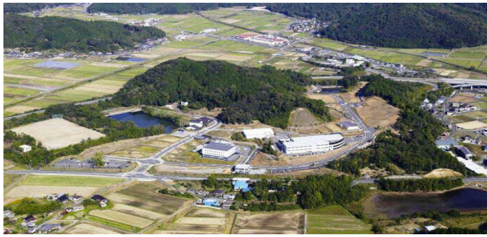
南丹市ものづくり団地 京都新光悦村