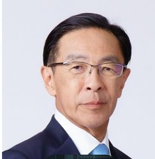
吉野 彰 氏 旭化成(株)名誉フェロー