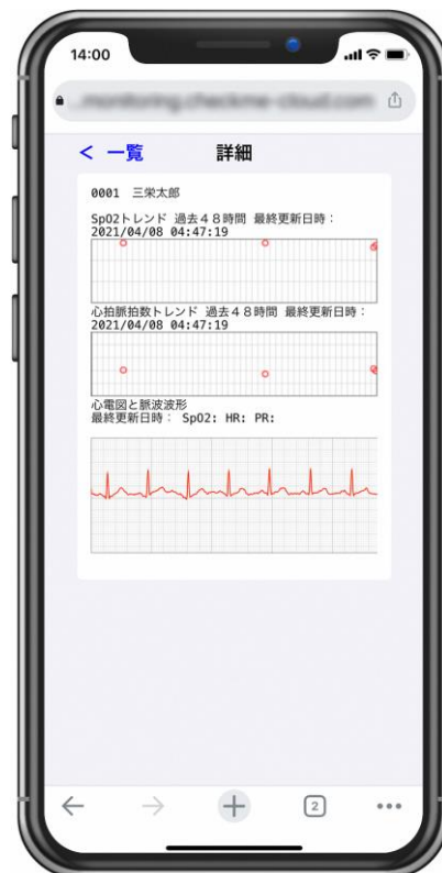
バイタルデータ詳細