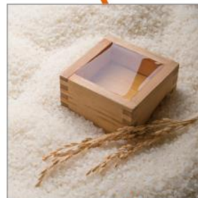
伏見の純米吟醸酒