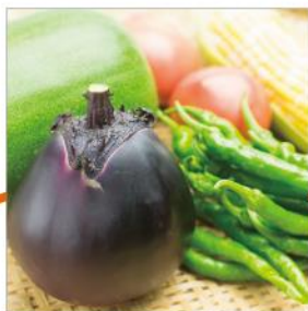
京都伝統野菜エキス