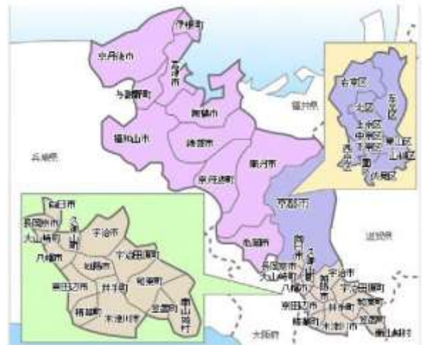
京都府内の行政区界