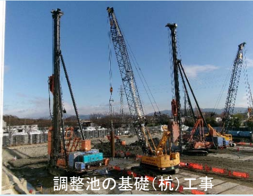
調整池の基礎(杭)工事