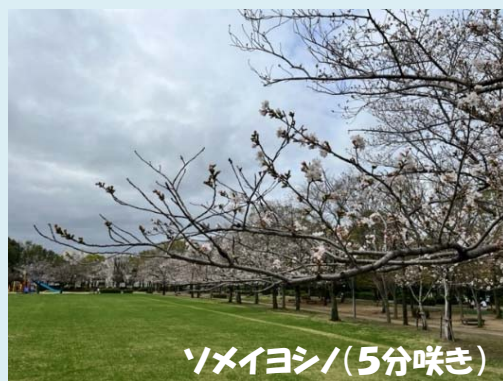
ソメイヨシノ(5分咲き)