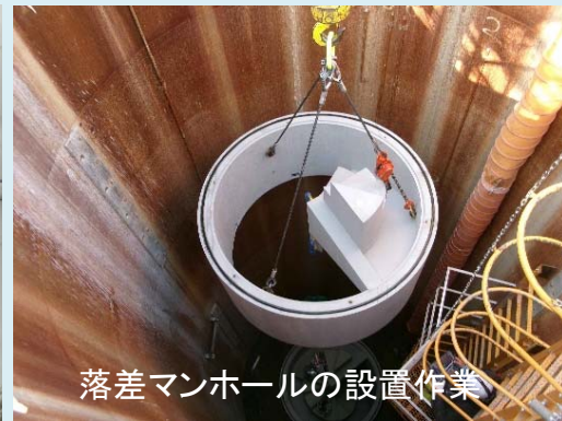
落差マンホールの設置作業