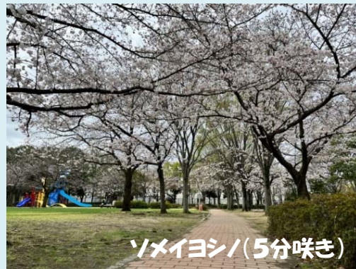
ソメイヨシノ(5分咲き)