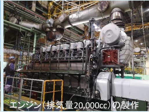
エンジン(排気量20,000cc)の製作