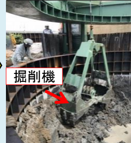
掘削機により、リングの内部を掘削