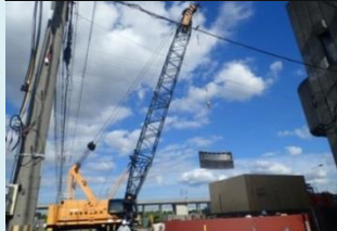
クレーンを使って鋼製枠を所定位置に移動