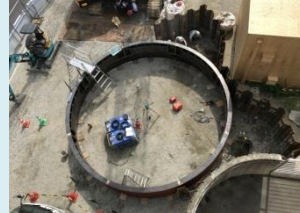
1リング目組立完了時(全景)