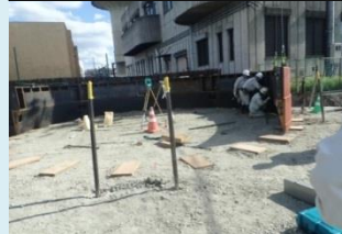
溶接とボルトで枠同士を固定し、リング状に組立