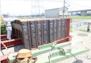
工場で製作された8分割の鋼製枠を現場に搬入