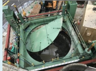
1リング分の掘削完了後、円形足場を用いて、圧入装置を残したままリングを組立(2リング目以降)