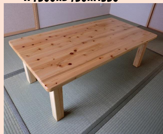
折り畳みテーブル 桧 並 W1500xD750xH350