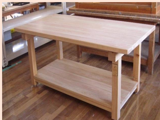
作業机 桧 上小節 W1800xD900xH715