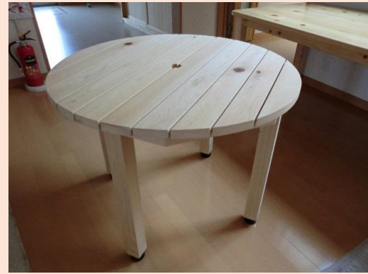
丸テーブル 桧 上小節 W900xD900xH700