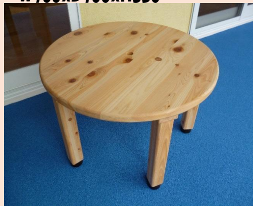
丸テーブル 桧 並 W700xD700xH350