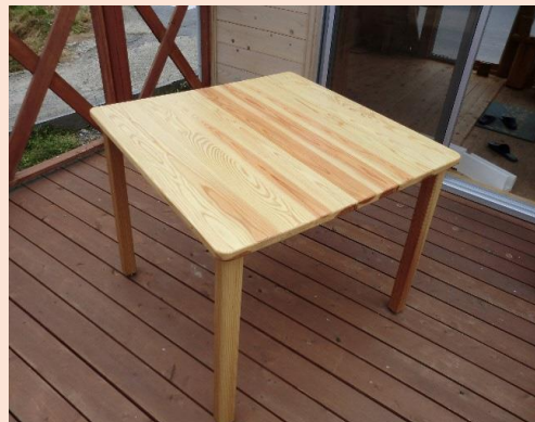
テーブル 桧 上小節 W900xD900xH700