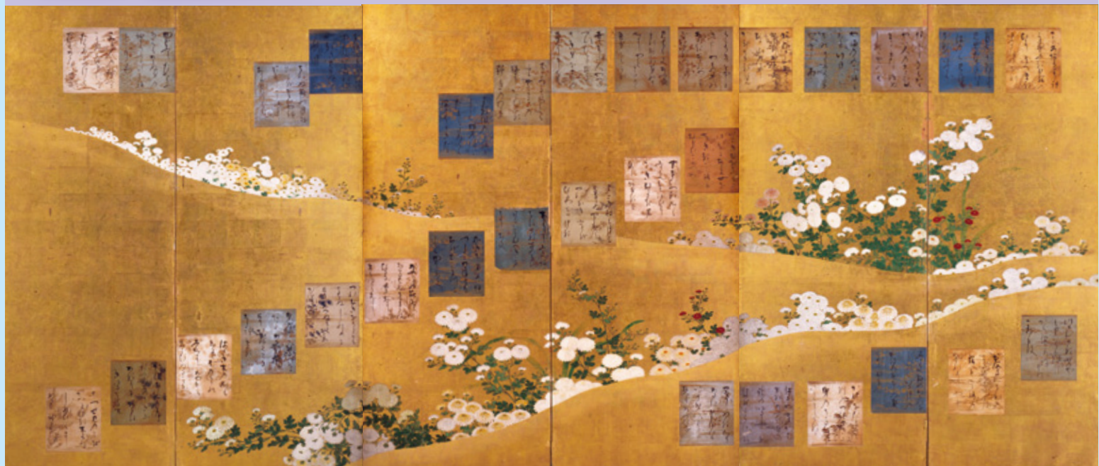
源氏物語和歌色紙貼交屏風