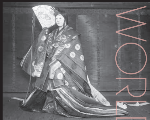
左:「壺装束」 中央:「七夕祭上方町屋秋晴装」 右:「五衣唐衣裳」