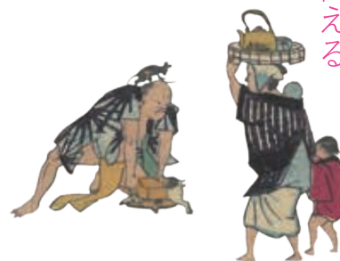
『宇治信樂 諸國御茶銘 雙六』より

第2部では、パネルを使って京都学・歴彩館の主たる業務内容を紹介し、第3部では、図書検索の案内動画を放映します。