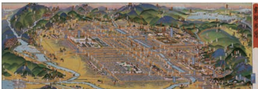
『京都』吉田初三郎作 大礼記念京都大博覧会事務局(1928)