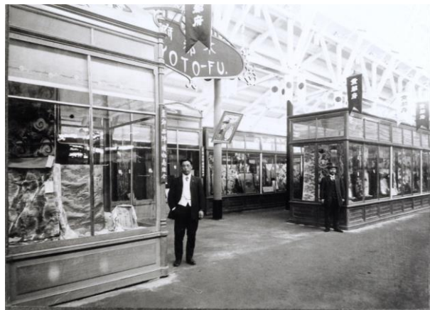
旧一号書庫写真資料 541「博覧会 京都市西陣織物商組合」(明治末～大正初期) * 2