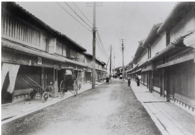
旧一号書庫写真資料 455「京都市西陣糸屋町之光景」(明治末～大正初期) * 2