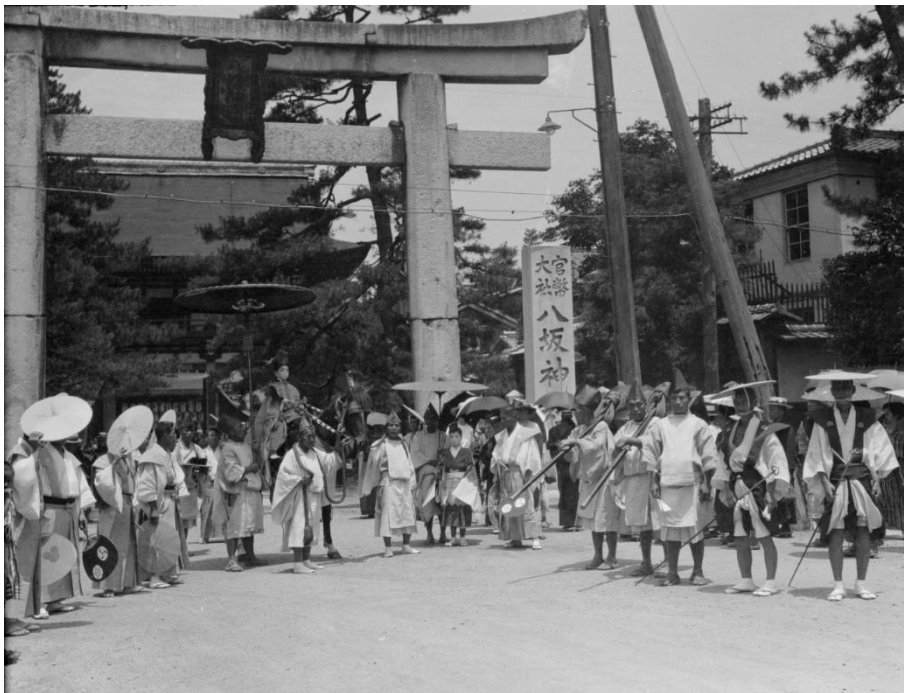
矢野家写真資料 No.120 稚児の社参 2

矢野家写真資料には、放下鉾の生き稚児の写真があります。町内から八坂神社に参拝するときの写真で、町内から出発するときの姿（No. 121 、 122 、 125 、 126 ）、八坂神社前の姿（No. 119 、 120 ）が写っています。