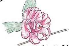
マルバノキ 小さい小さい赤い花です.. カンツバキ クチナシの実 色づき...