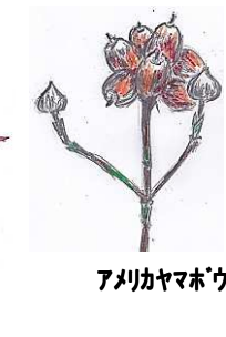
アメリカヤマボウシ