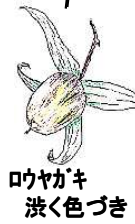
ロウヤカキ 渋く色づき