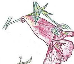
★ ツリフネソウ * 咲き始めました!