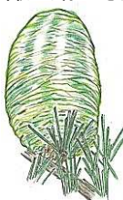
★ ヒマヤスキ 球果 昨秋から育ててきました...