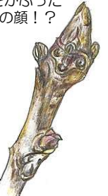
オニグルミ 冬芽と葉痕 帽子をかぶった 羊の顔!?