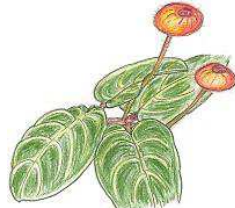
パールケア・ヒポキルティフロ *エクアドル原産! (温室:冷房室)