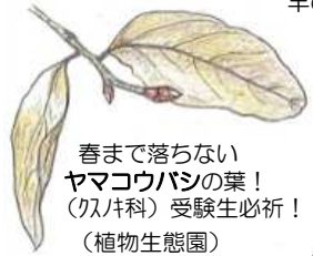
春まで落ちない ヤマコウバシの葉! (久津科) 受験生必祈! (植物生態園)