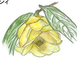
ベトナムの黄ツバキ カリア・クワフオンゲンス (温室: ラン室)