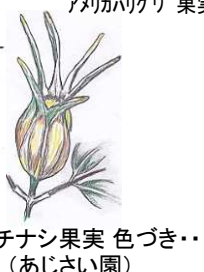
クチナシ果実 色づき.. (あじさい園)