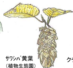
サワシバ黄葉 (植物生態園)