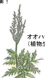
オオハナワラビ (植物生態園)