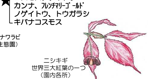
ニシキギ 世界三大紅葉の一つ (園内各所)