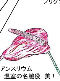
アンズリウム 温室の名脇役 美!