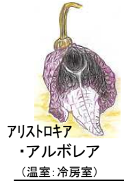
アリストロキア ・アルボレア (温室:冷房室)