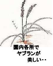
園内各所でヤブランが美しい...