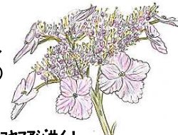
丹後ナデシコヤマアジサイ!