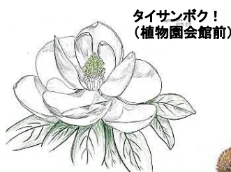
タイサンボク! (植物園会館前)