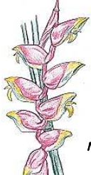
ホタルブクロ (植物生態園) *火垂りが由来?