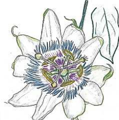
トケイソウ (ワイルドガーデン 四季彩の丘)