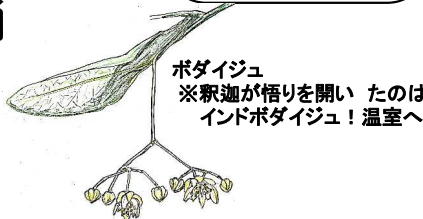
ポダイジュ *釈迦が悟りを開いたのは インドポダイジュ! 温室へ