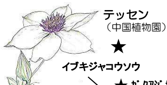
テッセン (中国植物園)