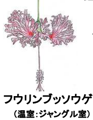
フウリンブッソウゲ (温室:ジャングル室)