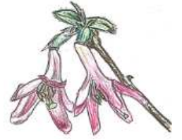
ウグイスカグラ 実に可愛い!