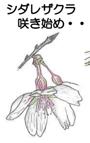
シダレザクラ 咲き始め..