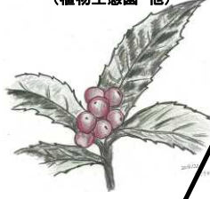
センリョウ (植物生態園 他)