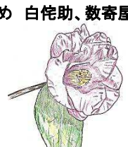
‘有楽’ * 織田信長の弟 が愛でたツバキ