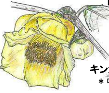
★ 林ゴウカ 赤花! 白花!