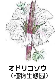
オドリコソウ (植物生態園)