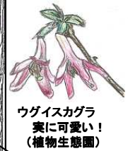
ウグイスカグラ 実に可愛い! (植物生態園)