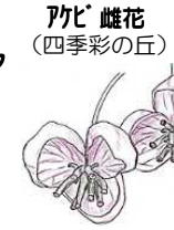
アキの姫 (四季彩の丘)