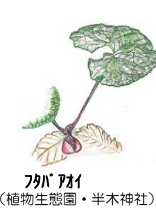
フタバアオイ (植物生態園・半木神社)