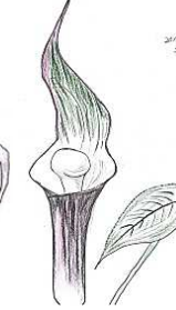
ユキモチソウ (植物生態園)