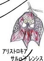
アリストロキア サルバドレンシス