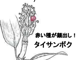
赤い種が顔出し! タイサンボク

★「正門花壇」 アフリカンマリゴールド ケイトウ トレンシア サルビア・レウカンタ ドーム菊