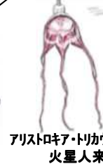
アリストロキア・トリカウダタ 火星人来襲!