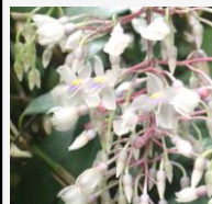
メディナ クラサタ