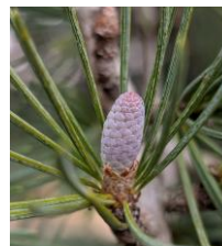
少しずつ育ってきたヒマラヤスギの球果

旧年中は京都府立植物園にお越しいただき、ありがとうございました。園内では植物たちが、それぞれ四季折々、可愛い姿を見せてくれました。私たちは、皆様に植物の魅力を楽しんで頂くだけでなく、植物を守り、次の世代へ繋いでいくことも大切な役割だと考えています。今年も、展示会・講習会・ガイドの情報や日々の植物たちの様子、生物多様性の保全につながる取組みについて、このたよりやインスタグラム等を通してお伝えしていきます。自然の奥深さや小さな発見を共有できれば嬉しいです。本年も京都府立植物園をどうぞ宜しくお願いいたします。皆様にとって、植物とともにある穏やかな一年になりますように。（A）