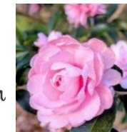
サザンカ 栽培品種