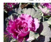
ハボタン '紅つぐみ'