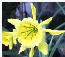
パラモンガイア ウェベルパウエリ