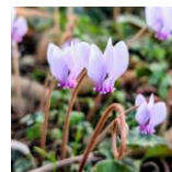
シクラメン コウム