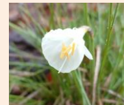
ナルキッス カンタプリクス