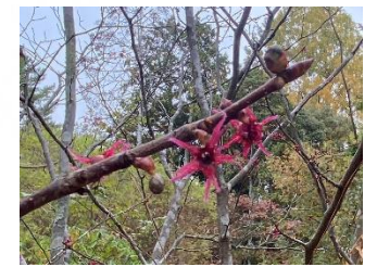
マルバノキ(あじさい園)