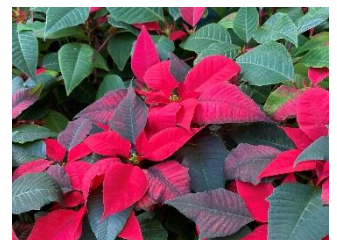
ポインセチア展(観覧温室内)