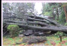
倒伏したレバノンスギ