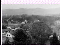
駐留軍の家族用住宅