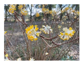
タイリンミツマタ