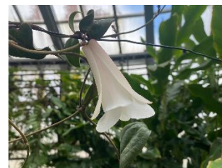
ツバキカズラ(白花)