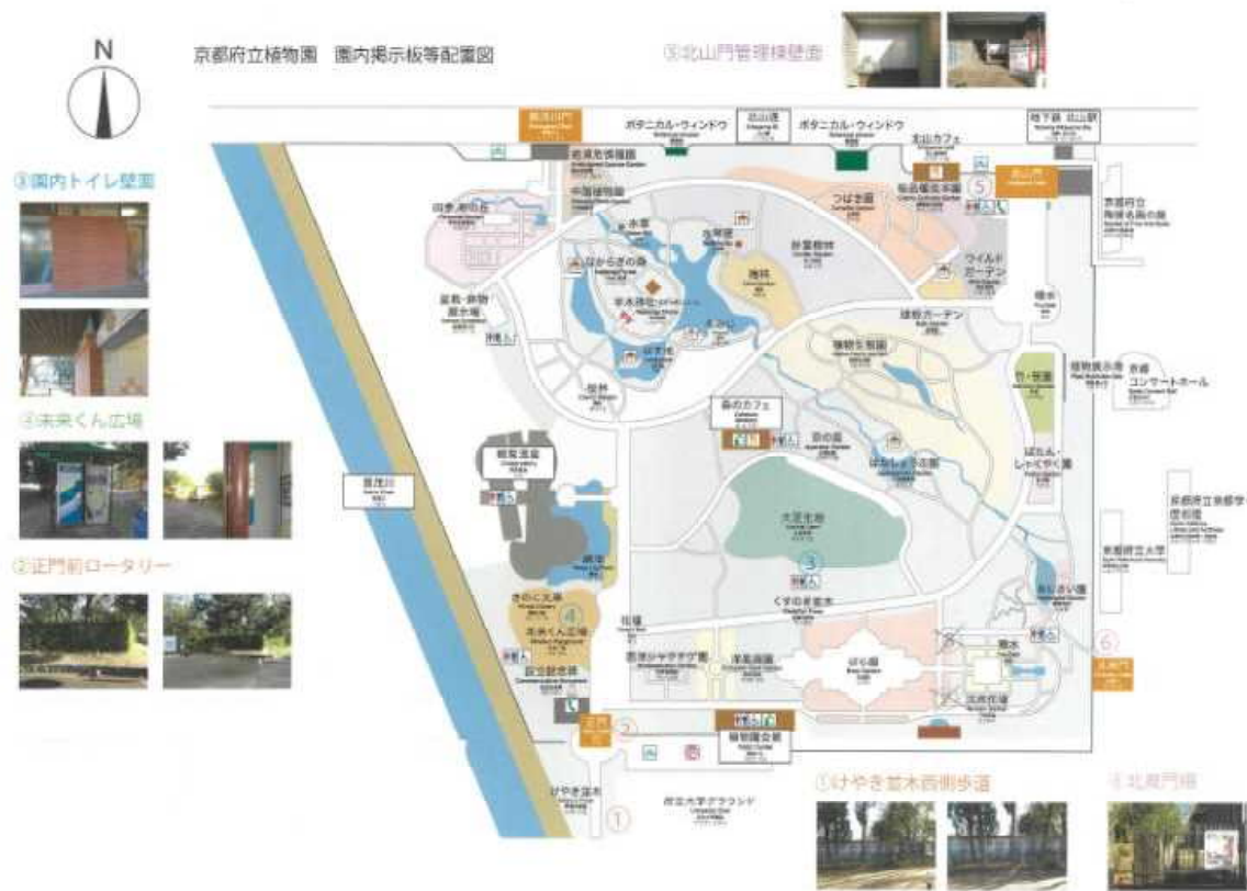
① けやき並木東側歩道