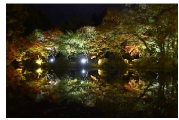
紅葉ライトアップ