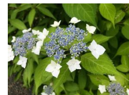
シロアマチャ(あじさい園)