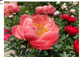
シャクヤク (ぼたん・しゃくやく園)