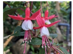
フクシア(観覧温室)