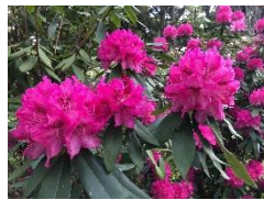
西洋シャクナゲ (西洋シャクナゲ園)