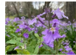
ショカツサイ (球根ガーデン: 針葉樹林南側)