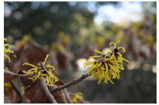
シナマンサク (くすのき並木北側)