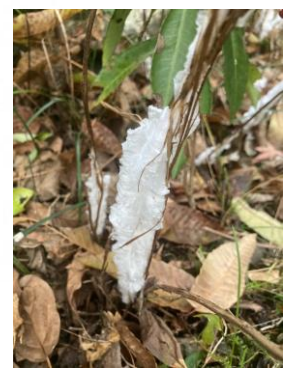
シモバシラ 氷点下になった朝に見られる 植物生態園の池付近