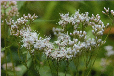
74 フジバカマ Eupatorium fortunei