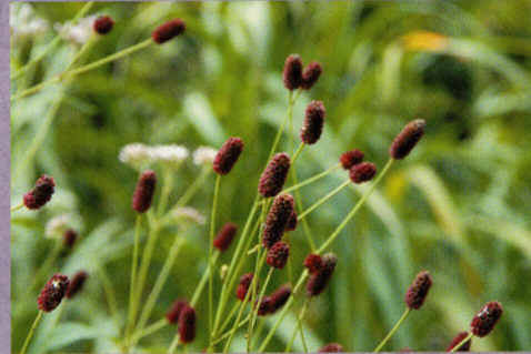
79 ワレモコウ Sanguisorba officinalis