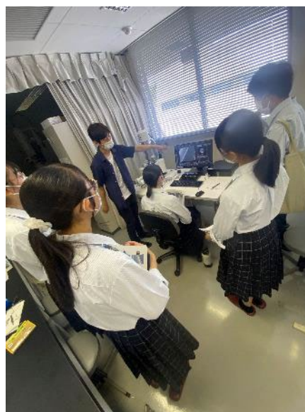
電子顕微鏡の操作体験