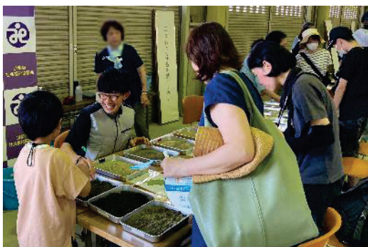
実験コーナーの様子