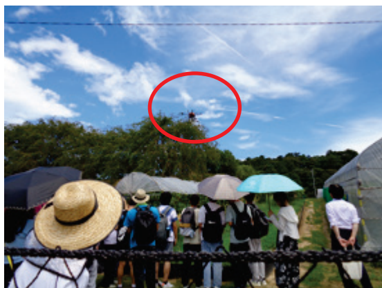
ハンティングドローンの実演

参加者からは、「おいしいものがたくさん買えてよかったです」、「初めてきたのですが、がいろんな体験ができたので楽しかったです」、「地域でいろんなことをしているのだと改めて感じました」との声をいただきました。