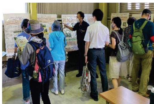
研究紹介コーナーの様子