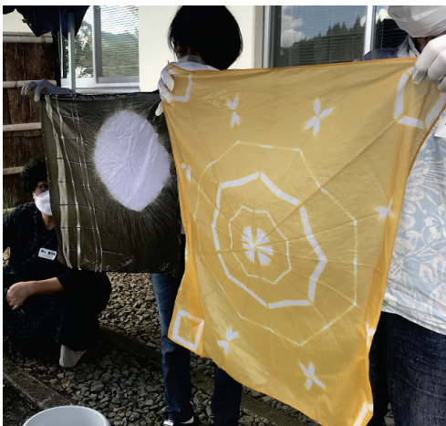
午前の部(初心者コース)・染め上がったバンダナ (用いる触媒により色合いが異なる)