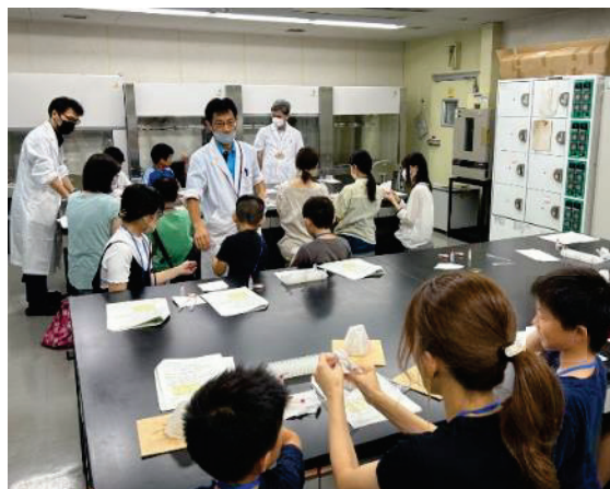
野菜を使った実験の様子