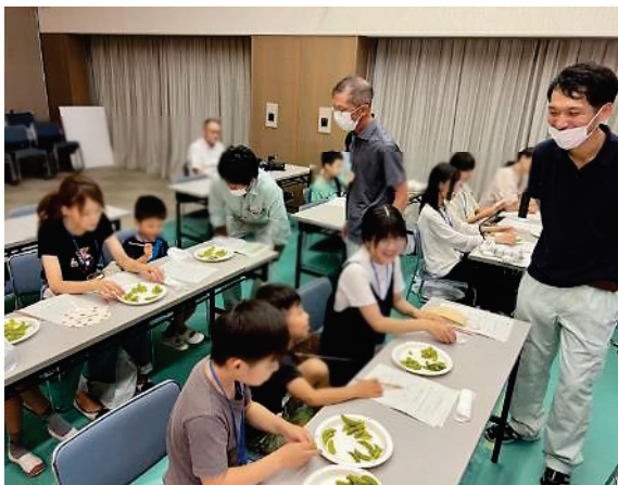
品種を食べ比べる試食体験の様子

来年度以降も当センターでは、施設公開を通じて最新の研究内容や京都府の農業について情報発信を行います。