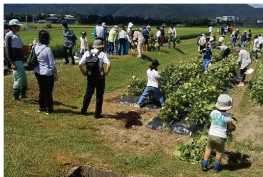
エダマメ収穫体験の様子