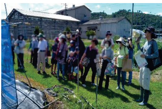
ほ場見学ツアーの様子

参加者からは、「いろいろ体験ができて面白かった」、「農林センターがどのような仕事をしているのか知ることができた」、「来年も実施してください」と多くの感想があり、たいへん好評でした。