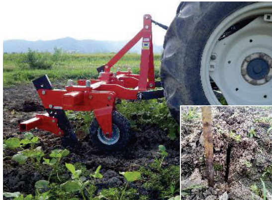
トラクタで畦間サブソイラをけん引している様子 (右下はけん引跡を横から見た図)

※畦間サブソイラ:土壌の表面は耕起せず、硬い耕盤に亀裂を入れて、透水性の改善を図る機器