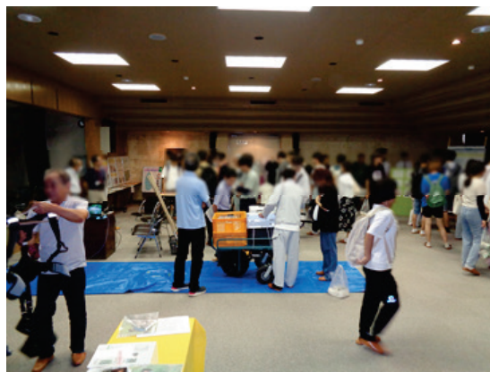
「見る・聞く」、「ふれる」コーナーの様子