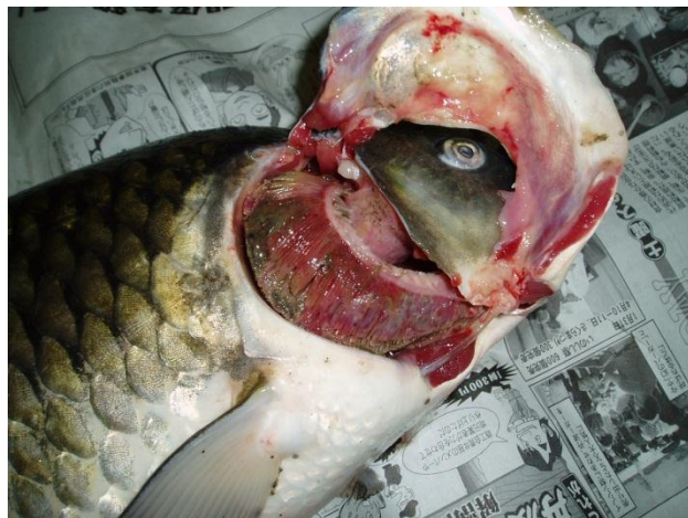
KHV病の症状②（鰓の退色、鰓腐れ）