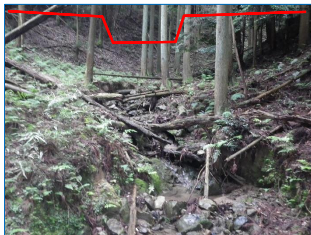
施工想定 (新設ダムで土砂流出抑止)