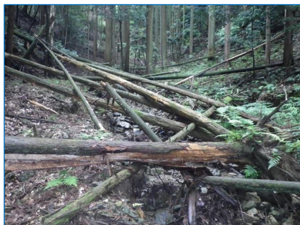
現況 (倒木 及び 荒廃状況)