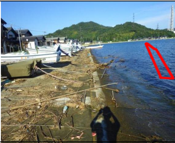
R 6 整備予定箇所