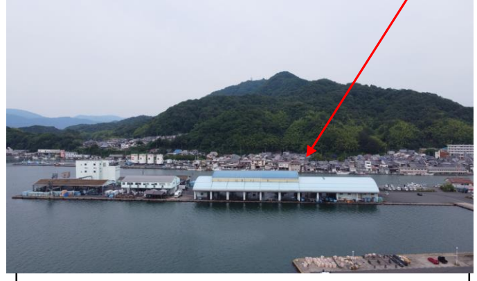
②高度衛生管理対策 卸売市場